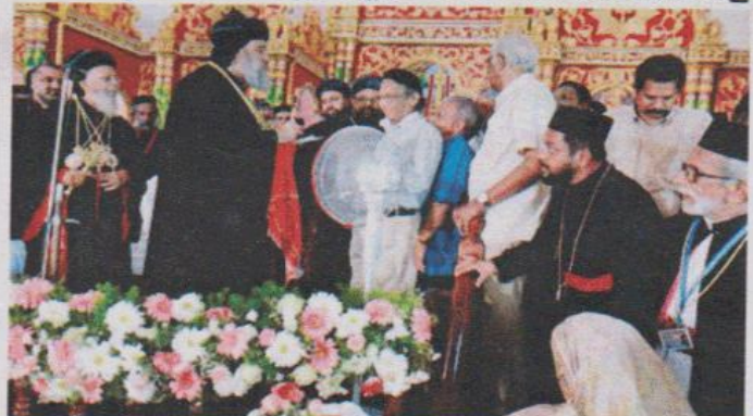
The Holy Father blessing our family members