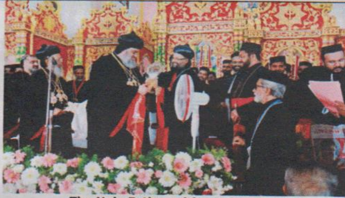
The Holy Father with our Patron